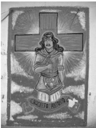
Ilustración Imagen del gauchito Gil

Son personajes que existieron o nacieron de leyendas populares, tal vez por acciones buenas o ser víctimas de injusticias pero sin vínculo con la Iglesia, o un vínculo que no ha sido avalado como tal. Podemos encontrar aquí nombres como: San Simón (Maximón) en Centroamérica, el Gauchito Gil en Argentina, la Santa Muerte en México o María Lionza en Venezuela. Preocupa que muchos católicos sean engañados creyendo que estos son santos católicos y hasta van inocentemente a sus santuarios.