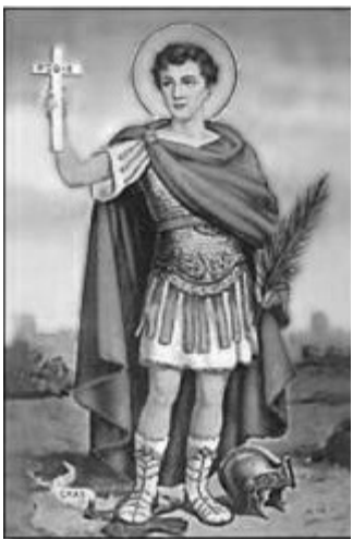
Ilustración Imagen de San Expedito

Este grupo realmente no es de santos falsos, pero sí de cuyas vidas se han mantenido datos legendarios no comprobados. Por ejemplo: san Jorge y la lucha con el dragón es parte de leyendas, aun cuando el santo sí existió e incluso es patrono de muchos pueblos. Muchos otros santos fueron quitados por la Iglesia del Martirologio Romano pero dejando en casos el culto local como por ejemplo: San Expedito. Casos también como el de Santa Úrsula, Santa Filomena o San Cristóbal, quienes siguen siendo santos pero sin culto dentro de la liturgia universal, debido a lo difícil de comprobar los datos históricos de su