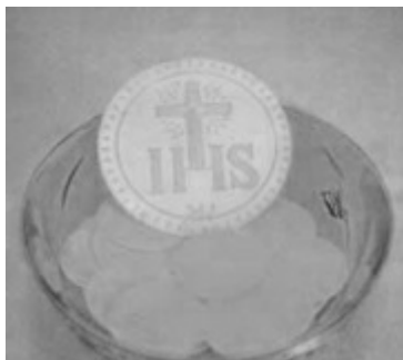
Ilustración Inicial IHS

Algunas sectas han buscado darle significado a las iniciales inscritas en las sagradas especies como conexión con el paganismo. Dicen que durante los días de los emperadores romanos, existían muchos adoradores de Isis (la diosa egipcia representante de la diosa babilónica) en Roma; y supuestamente los cristianos corrompidos dejaron las iniciales de la triada egipcia Isis, Horus, Seb; en otras palabras, «La Madre, el