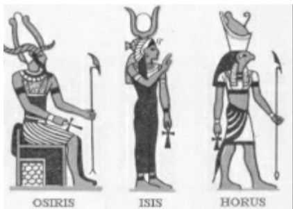
Ilustración Triada egipcia

Lo más curioso del ataque anticatólico es que no toma cuidado de la argumentación que usa y hacen referencia a una triada egipcia compuesta supuestamente por Isis – Horus – Seb. Dentro de la mitología egipcia que tiene múltiples dioses, Geb y Nut tuvieron varios hijos, entre esos Osiris (varón) e Isis (mujer). Estos se casaron y tuvieron un hijo llamado (Horus).