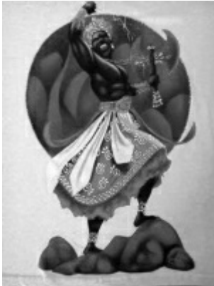
Ilustración Imagen del falso santo Shangó

En este grupo principalmente se tiene a la santería, religión africana que llegó a Brasil y Cuba proveniente de la tribu Yoruba. Estos esclavos venidos a América, mezclaron sus dioses y los “escondieron” también bajo nombres católicos. Esto es peligroso pues muchas veces inocentemente un católico puede ver una imagen de un “santo” en algún sitio y pensar que está en algo de Dios, y termina donde un brujo o algún embaucador. Los Yoruba llaman a sus dioses “orisha” y los fueron asociando a nuestros santos según su apariencia o la cualidad que se resaltaba del santo. Por ejemplo: ellos llaman a Shangó y lo asocian a imágenes de Santa Bárbara, o a Babalú con San Lázaro, o a Yemayá con la Virgen de la Regla. Esto llegó a la música salsa con Richie Ray o Celia Cruz.